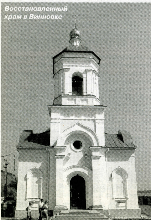
Восстановленный храм в Винновке

Лес закончился неожиданно. Деревья просто расступились, и мы тутчас оказались в настоящей степи. Справа и слева, насколько хватает глаз, почти до самого горизонта – бескрайние поля. Винновские горы, самая высокая точка которых всего 177 метров, «убежали» за очередной поворот. И еще километров семь мы чувствовали себя настоящими «кочевниками».