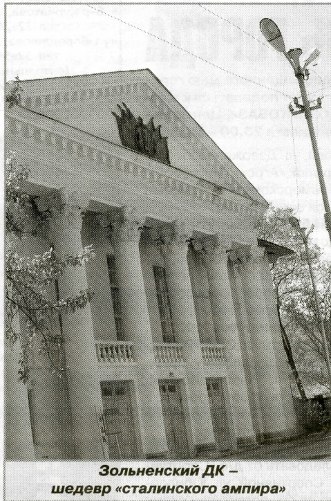
Зольненский ДК – шедевр «сталинского ампира»

Нынешнее Зольное застроено одно- и двухэтажными каменными домами – не только обычными деревенскими, но и навороченными коттеджами. Имеются поселковый совет, больница, почта, клуб. На улицах много молодежи, вероятно, дачники, местные жители в основном люди пожилые. Название селу дал Зольный овраг – когда-то здесь было производство золы, используемой при изготовлении поташа – промышленного углекислого калия. Но вообще-то Зольное всегда считалось поселком нефтяников. Изображение нефтяной вышки украшает «герб» на фронтоне местного ДК «Нефтяник» – величественного образца архитектурного стиля «сталинский ампири». Колоннада снаружи, помпезная лепнина внутри и особенный запах старых деревянных полов. В этом ДК и находится музей-театр «Жигулевская сказка».