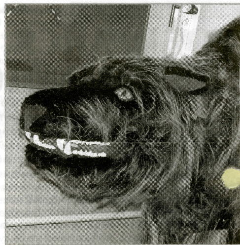
С «чудой» Волкодиром, по легенде, сражался сам Степан Разин. Отрубив Волкодиру голову и распоров брюхо, Стенька нашел внутри камень. Лизнул его и «узнал все, что есть на свете».