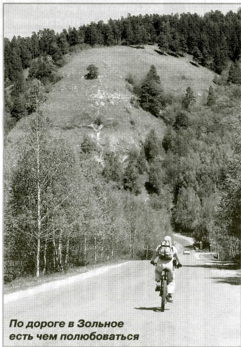
По дороге в Зольное есть чем полюбоваться

Дорога на Зольное проходит мимо села Бахилова Поляна. Появилось оно примерно в XVII веке как место временного жилья охотников, добытчиков известняка, пасечников и бакенщиков. Сегодня здесь проживает не более полутора сотен человек, в основном дачники, а также сотрудники Жигулевского заповедника, управление которого находится в Бахиловой Поляне с 1935 года.