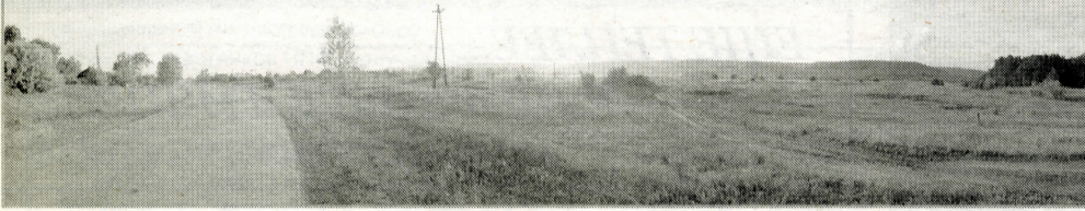
Справа на горизонте – Шелехметские горы