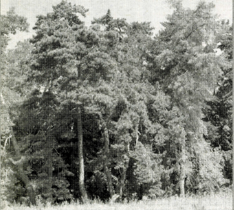
Новинский бор – памятник природы