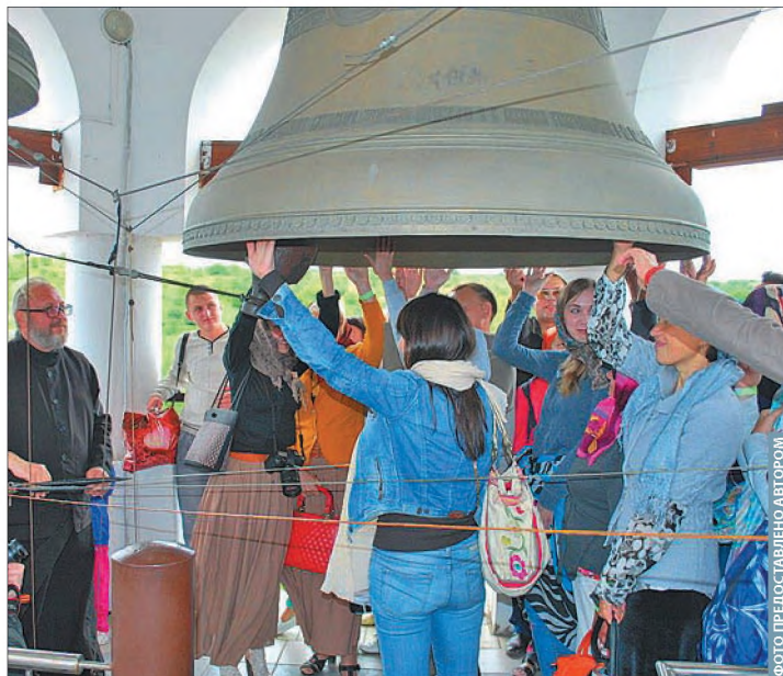
И детям, и взрослым интересно попробовать себя в роли звонаря