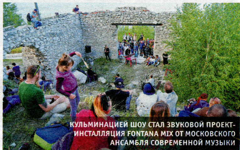
КУЛЬМИНАЦИЕЙ ШОУ СТАЛ ЗВУКОВОЙ ПРОЕКТ-ИНСТАЛЛЯЦИЯ FONTANA MIX ОТ МОСКОВСКОГО АНСАМБЛЯ СОВРЕМЕННОЙ МУЗЫКИ