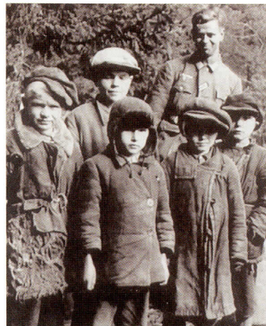
1948 год. 18 лет