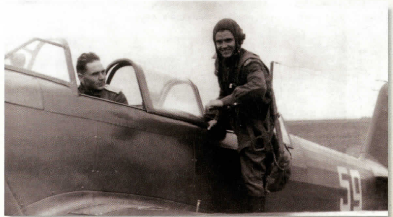
Военные сборы 1956 года. Капитан запаса