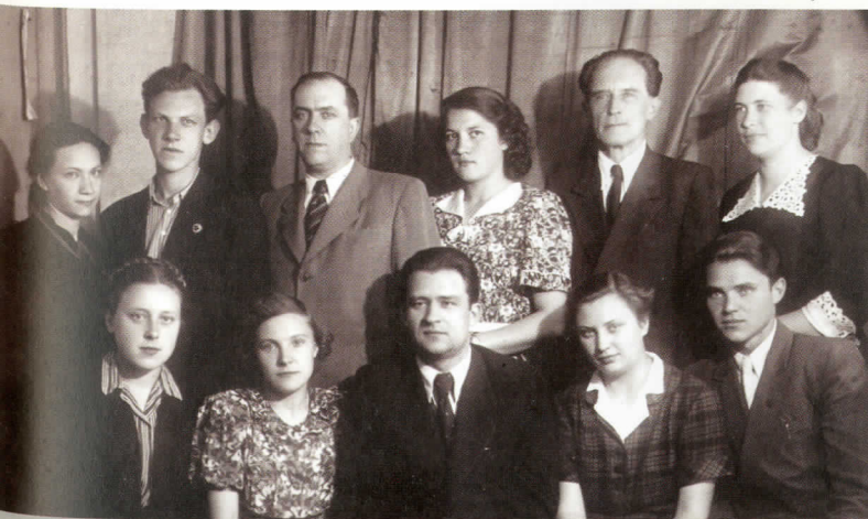
Профком МИЭИ. 1952 год