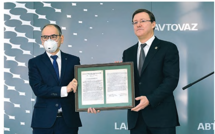
ДМИТРИЙ АЗАРОВ ПОЗДРАВИЛ РАБОТНИКОВ ЗАВОДА