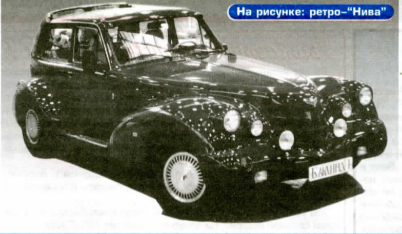
На рисунке: ретро-"Нива"