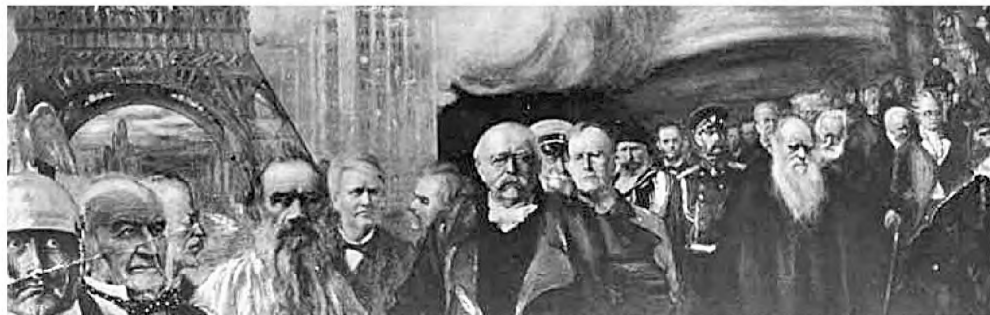
• Художественная карточка с репродукцией картины Модеста Дурнова «XIX век»

Зато сохранились спроектированные Модестом Дурновым железнодорожный вокзал в Муроме, торговые ряды в Томске и, конечно, здание музея в Москве по адресу: Леонтьевский переулок, дом 7.