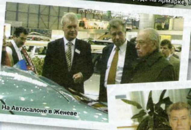
На Автосалоне в Женеве