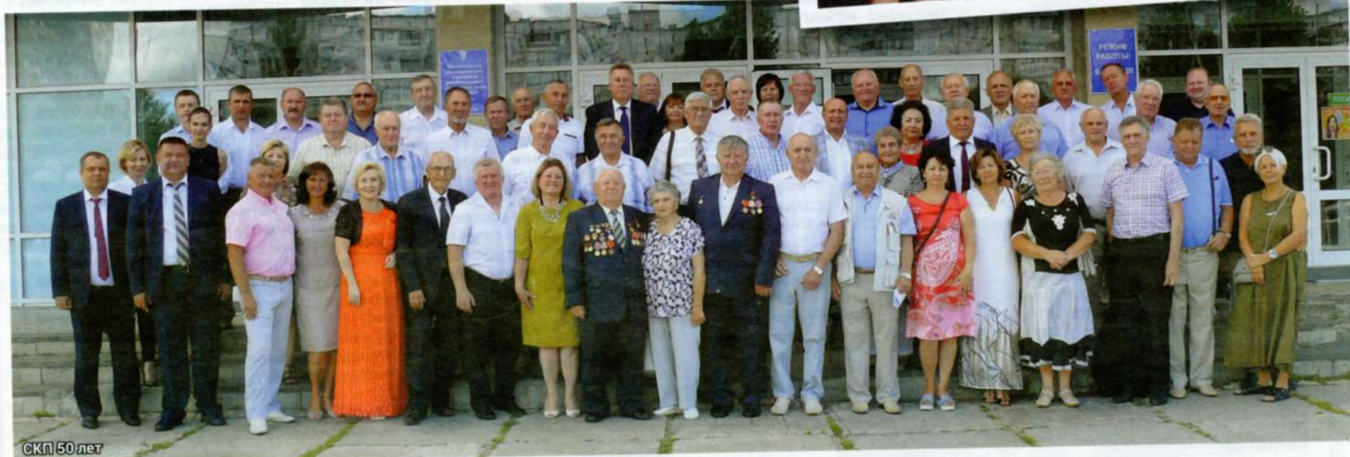
СКП 50 лет