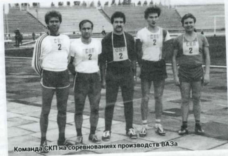
Команда СКП на соревнованиях производств ВАЗа