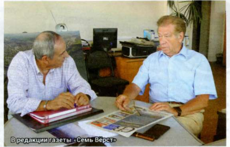
В редакции газеты «Семь Вёрст»

... ВСПОМИНАЮ СИТУАЦИЮ в конце 1995 года, когда завод был в очень сложной ситуации. От момента перехода ВАЗа в ОАО процесс пошел не так, как нужно. Нам не хватало опыта в тот организационный период, мы оказались правопреемниками всех долгов ВАЗа перед государством, и эти миллиардные долги перешли на открытое акционерное общество. Мы должны были их возвращать. Денег не было, пришлось заниматься бартером. Далее стояли две главные задачи, кроме госзадолженности по налогам. Это расчет с персоналом завода за почти полугодовую задержку по заработной плате и возобновить подготовку производства по автомобилю ВАЗ-2110. Без решения этих двух задач невозможно было продолжать работу завода. И нам удалось решить эти две задачи, опираясь на коллектив.