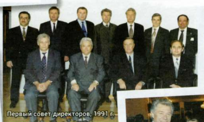
Первый совет директоров, 1991 г.