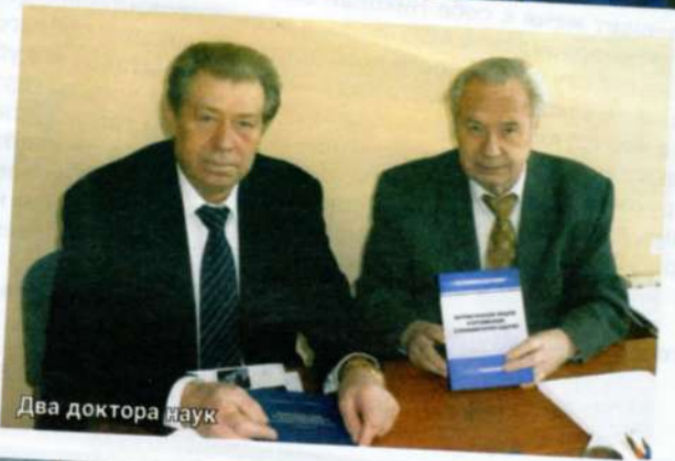
Два доктора наук