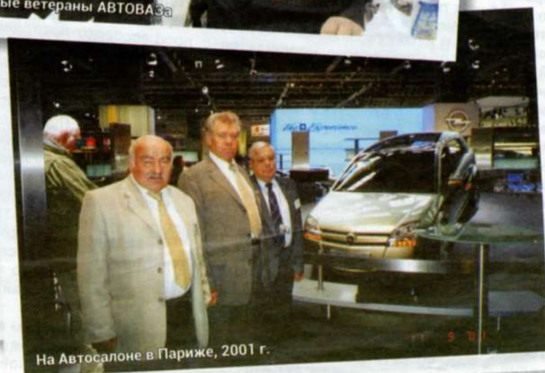
На Автосалоне в Париже, 2001 г.