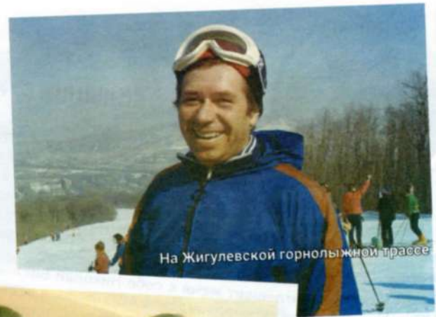
На Жигулевской горнолыжной трассе