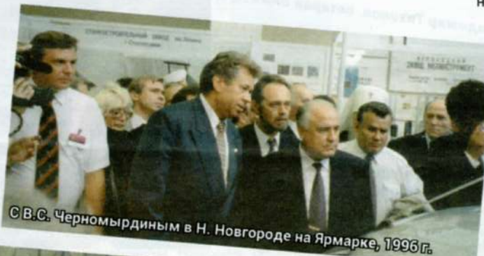
С В.С. Черномырдиным в Н. Новгороде на Ярмарке, 1996 г.