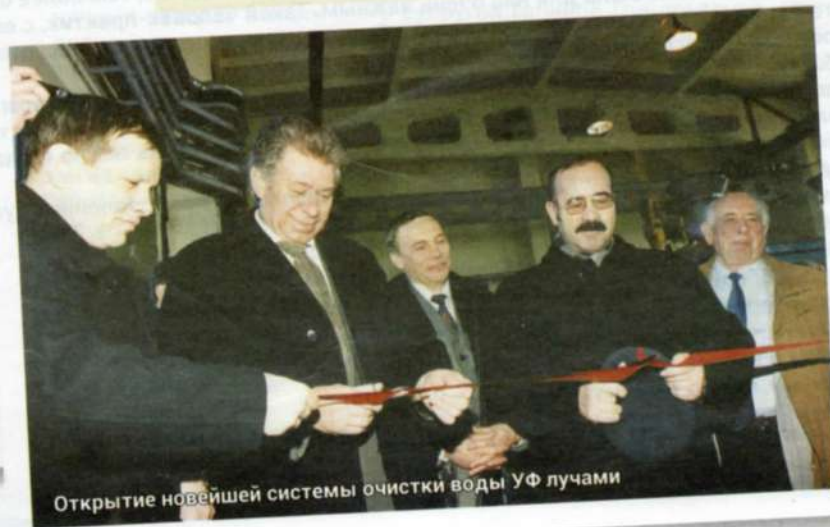
Открытие новейшей системы очистки воды УФ лучами

С глубоким уважением, ректор Самарского государственного экономического университета, д.э.н., профессор, заслуженный экономист РФ, председатель комитета по бюджету, финансам, налогам, экономической и инвестиционной политике Самарской губернской думы Г.Р. Хасаев