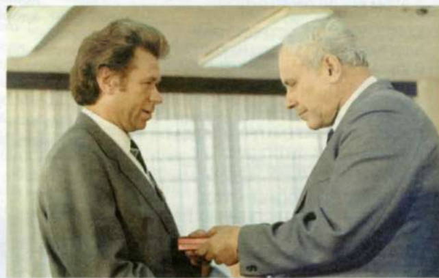
ВРУЧЕНИЕ ПЕРВОГО ОРДЕНА