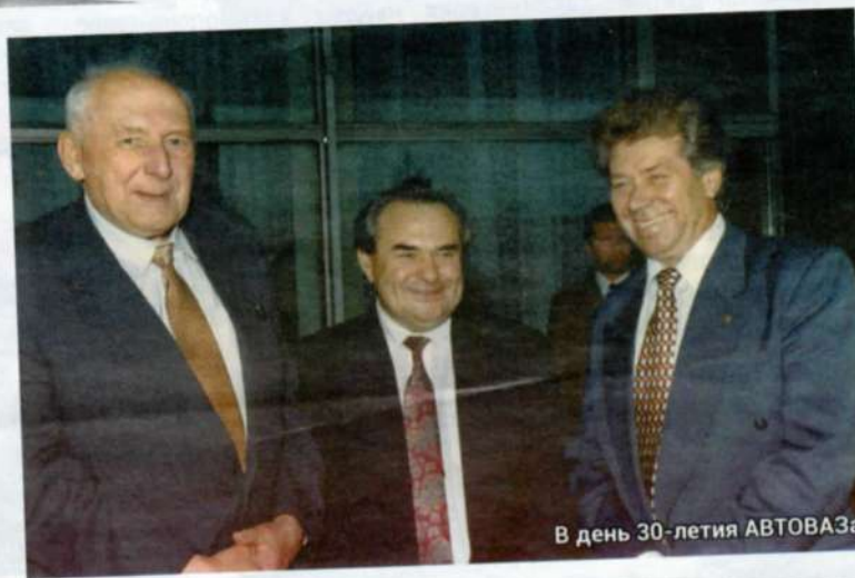
В день 30-летия АВТОВАЗа