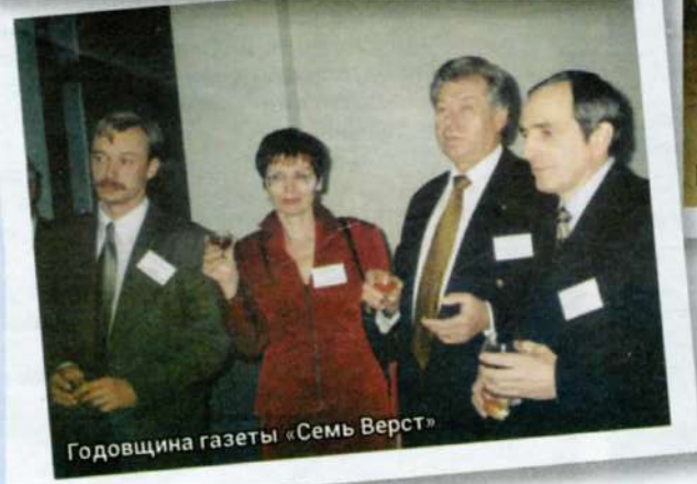
Годовщина газеты «Семь Вёрст»