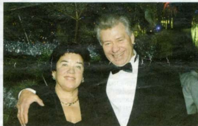
СО СПУТНИЦЕЙ ЖИЗНИ