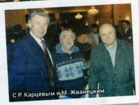
С Р. Карцевым и М. Жванецким