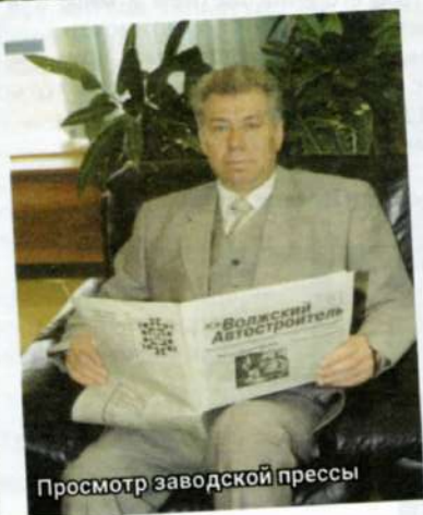
Просмотр заводской прессы