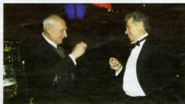
УЧИТЕЛЬ И УЧЕНИК