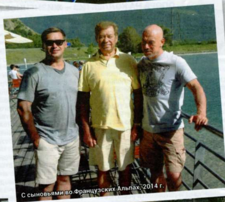
С сыновьями во Французских Альпах, 2014 г.