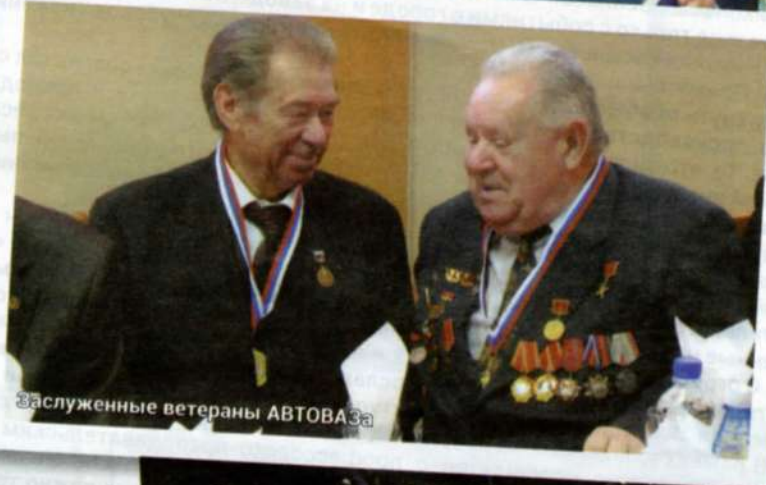
Заслуженные ветераны АВТОВАЗа