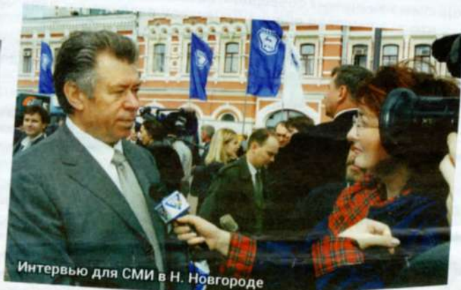
Интервью для СМИ в Н. Новгороде