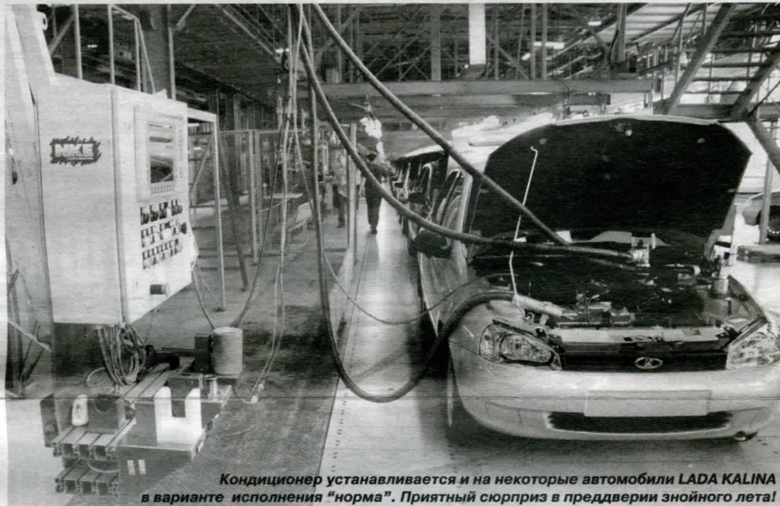
Кондиционер устанавливается и на некоторые автомобили LADA KALINA в варианте исполнения "норма". Приятный сюрприз в преддверии знойного лета!