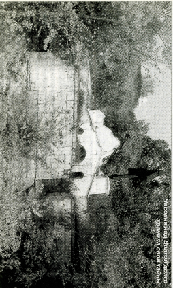
Часовня над Волгой. Долго хранила свои тайны

Владельцам дач в поселке Ермаково наверняка приходилось видеть стоящий у обрыва над Волгой большой православный металлургический крест. Кто осмеливался подойти ближе или путешествовал в этих местах по Волге, знают, что чуть ниже креста, у подножия глиняной кручи, почти у самой воды есть еще и маленькая часовня. Что это – чей-то склеп? Или установлено сооружение в память о каком-то важном событии? Тогда о каком? С просьбой рассказать об этом обратились в редакцию некоторые наши читатели. И хочется сказать им за это большое спасибо, ведь история креста над Волгой и человека, который похоронен под ним, – интересна и поучительна.