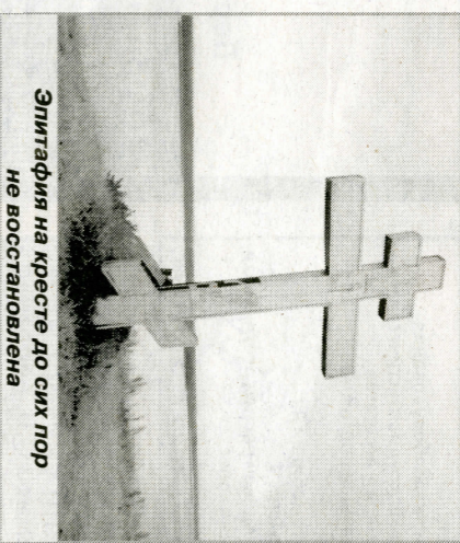
Эпитафия на кресте до сих пор не восстановлена