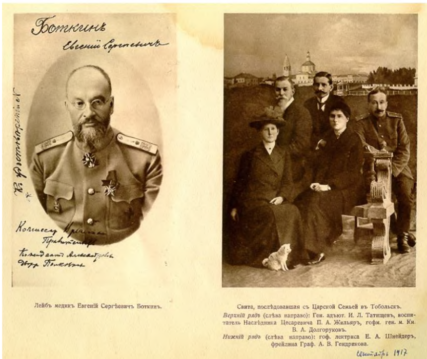
Лейбъ-медицъ Евгенийъ Сергѣевичъ Боткинъ.