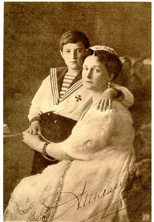
Е. И. В. Государыня Императрица съ Наслѣдникомъ Цесаревичемъ.

Мельникъ Т.Е. (рожденная Боткина) Воспоминанія о царской семьѣ и ея жизни до и послѣ революціи. Порядковый номер в каталогѣ - 608