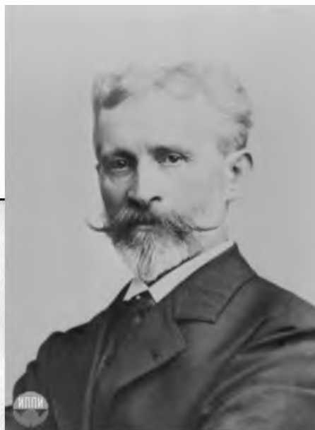
Портрет Фридриха Лоренца Лоренц Ф. Руководство къ всеобщей исторіи Порядковые номера в каталоге - 12, 13, 14