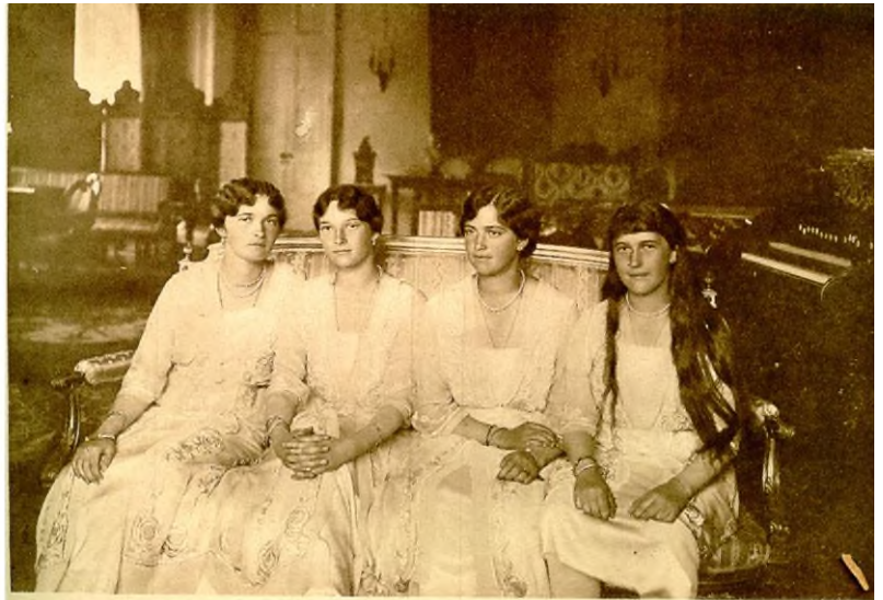
Группа Великихъ Княженъ: Ольги, Татьяны, Маріи и Анастасіи въ Царскомъ Селѣ.