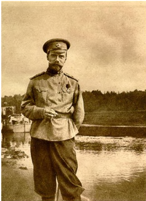
Е. И. В. Государь Императоръ въ Ставкѣ.