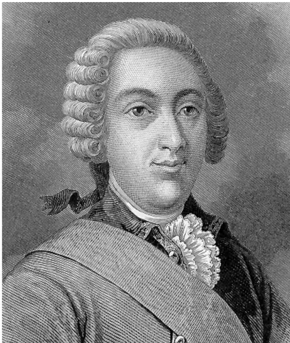
Князь Иванъ Алексѣевичъ Долгорукой, ОБЕРЪ-КАМЕРГЕРЪ И СВ. АНДРЕЯ КАВ., РОД. 1708 Г., КАЗНЕНЪ 26 ОКТ. 1739 Г

ПРИЛОЖЕНІЕ КЪ "РУССКОЙ СТАРИНѢ" ИЗД. 1878 Г.