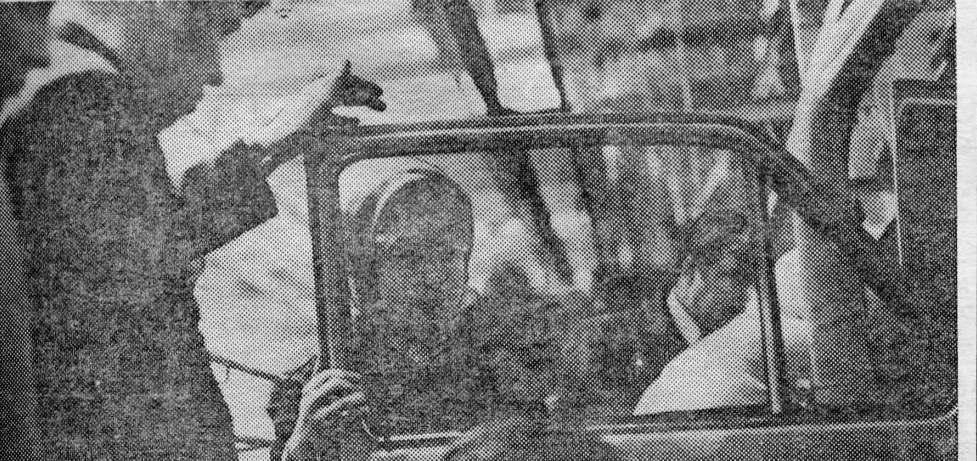
ГРАФИК ПРОИЗВОДСТВА — ЗАКОН