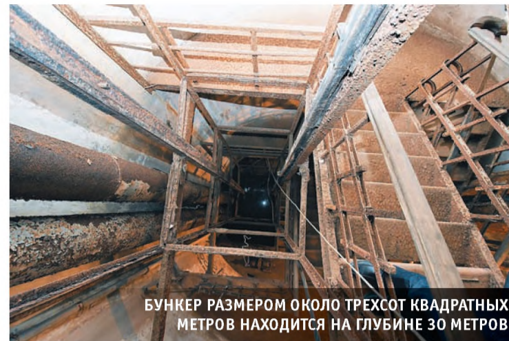
БУНКЕР РАЗМЕРОМ ОКОЛО ТРЕХСОТ КВАДРАТНЫХ МЕТРОВ НАХОДИТСЯ НА ГЛУБИНЕ 30 МЕТРОВ

«Народный музей», как мы назвали его три года назад, развивается, не только пополняясь новыми экспонатами. Важно, что законсервированный памятник в том состоянии, в котором он до нас дошел, сегодня получает «второе дыхание».