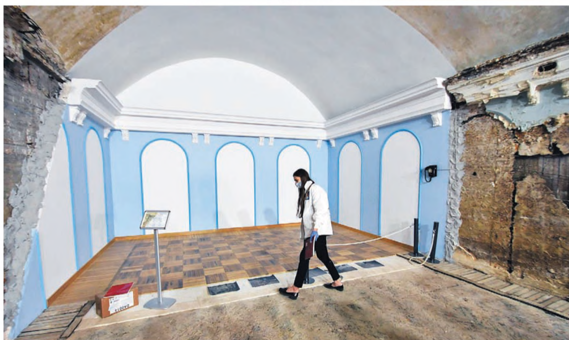
МОЖНО УВИДЕТЬ КОНТРАСТ МЕЖДУ ТЕМ, КАК ВЫГЛЯДЕЛИ ИНТЕРЬЕРЫ В 1940-Х, И В КАКОМ СОСТОЯНИИ ОНИ ДОШЛИ ДО НАС

Большая часть известных бомбоубежищ расположена в исторической части города, однако есть объекты и в других районах. К ним относится и бункер на территории военного санатория «Волга» на 7-й просеке, в котором, в случае необходимости, планировали разместить командный пункт Министерства обороны СССР.