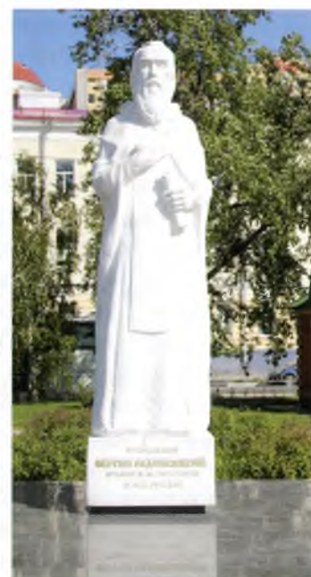
Памятник и часовня святителя Алексия