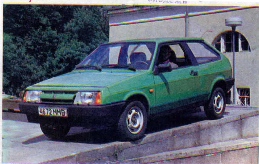
Первый отечественный переднеприводной автомобиль ВАЗ-2108.